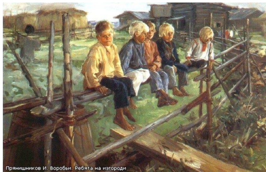
Прянишников И. Воробы. Ребята на изгороди

Придумай названия к картинкам и историю к понравившемуся сюжету.