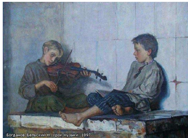
Богданов-Бельский Н. Урок музыки. 1897