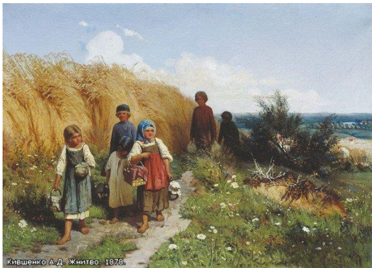
Кившенко А. Д. Жнитво. 1878.